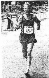
Auch in Tallinn ist er bereits gelaufen.